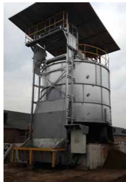
Установка по переработке помета